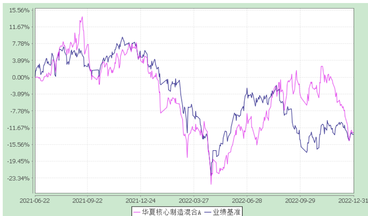
华夏核心制造混合 C