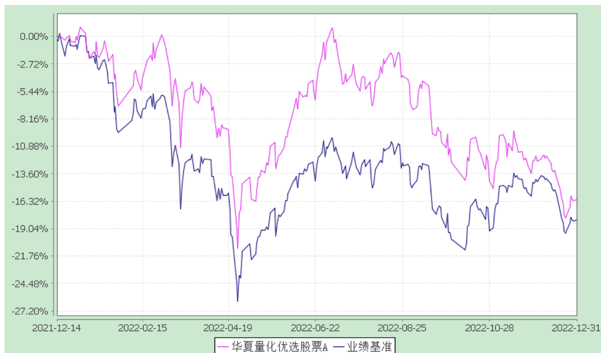
华夏量化优选股票 C