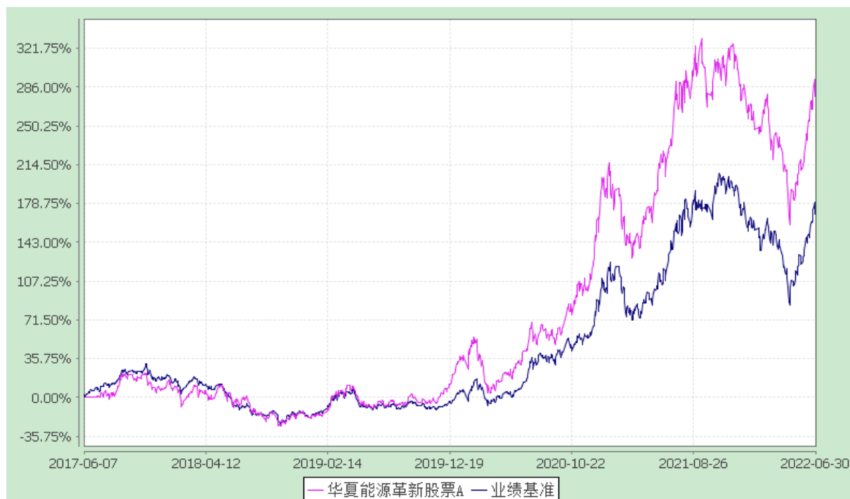
华夏能源革新股票 C