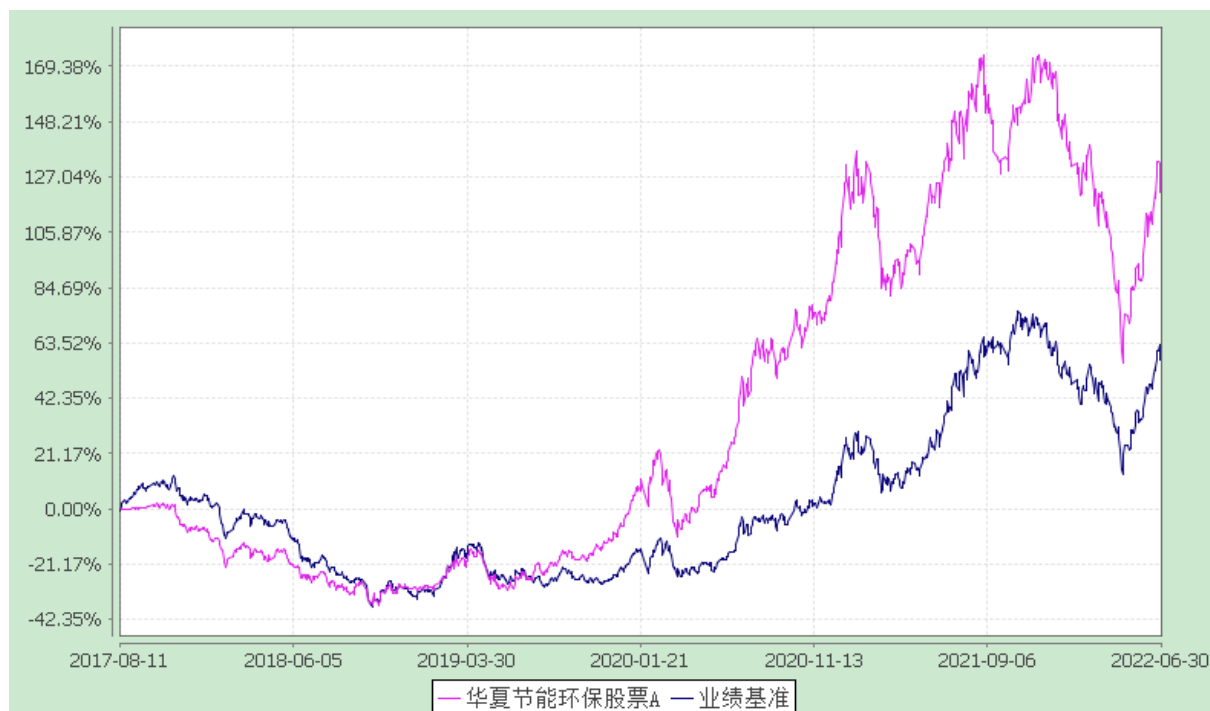
华夏节能环保股票 C