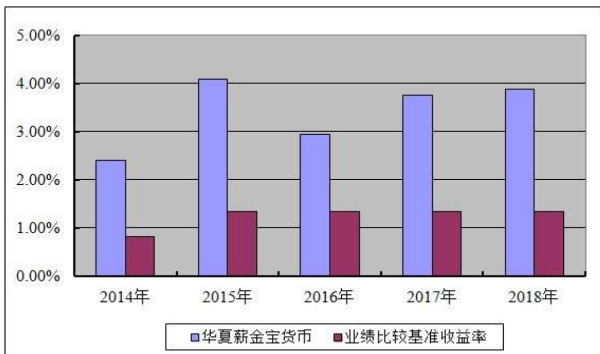
基金每年净值收益率与同期业绩比较基准收益率的对比图

注：本基金合同于 2014 年 5 月 26 日生效，合同生效当年按实际存续期计算，不按整个自然年度进行折算。