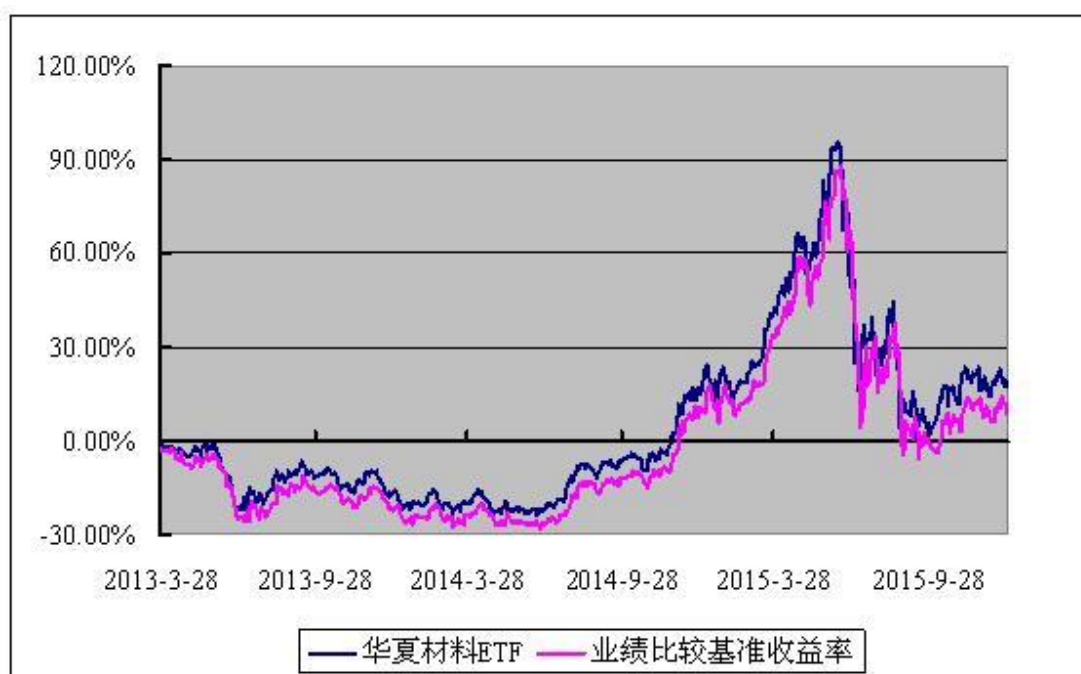
上证原材料交易型开放式指数发起式证券投资基金 份额累计净值增长率与业绩比较基准收益率历史走势对比图 (2013 年 3 月 28 日至 2015 年 12 月 31 日)