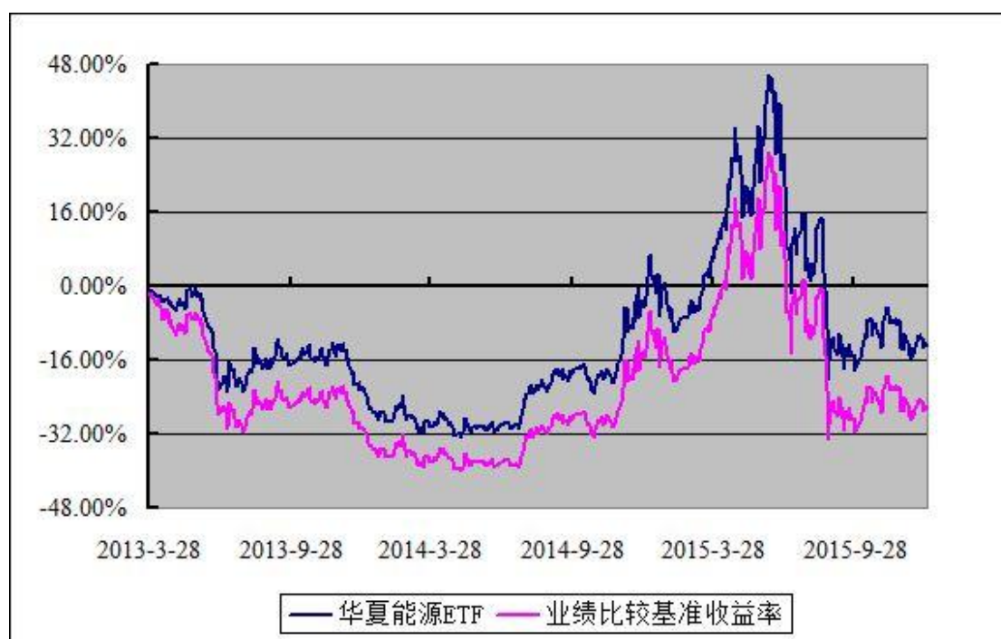
上证能源交易型开放式指数发起式证券投资基金 份额累计净值增长率与业绩比较基准收益率历史走势对比图 (2013 年 3 月 28 日至 2015 年 12 月 31 日)