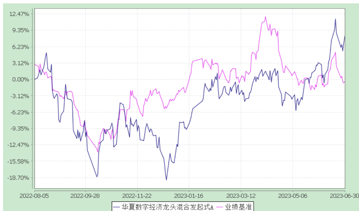
华夏数字经济龙头混合发起式 C: