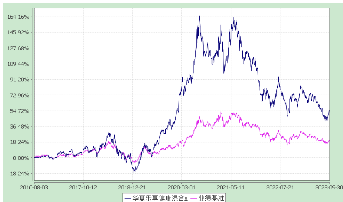
华夏乐享健康混合 C: