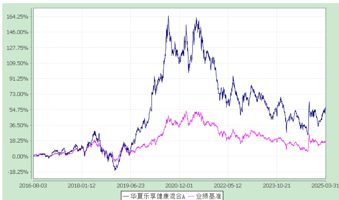
华夏乐享健康混合 C: