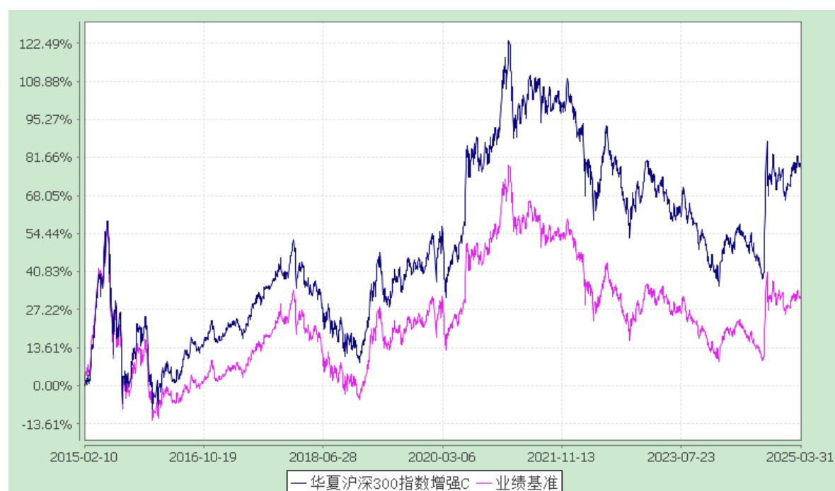
华夏沪深 300 指数增强 Y: