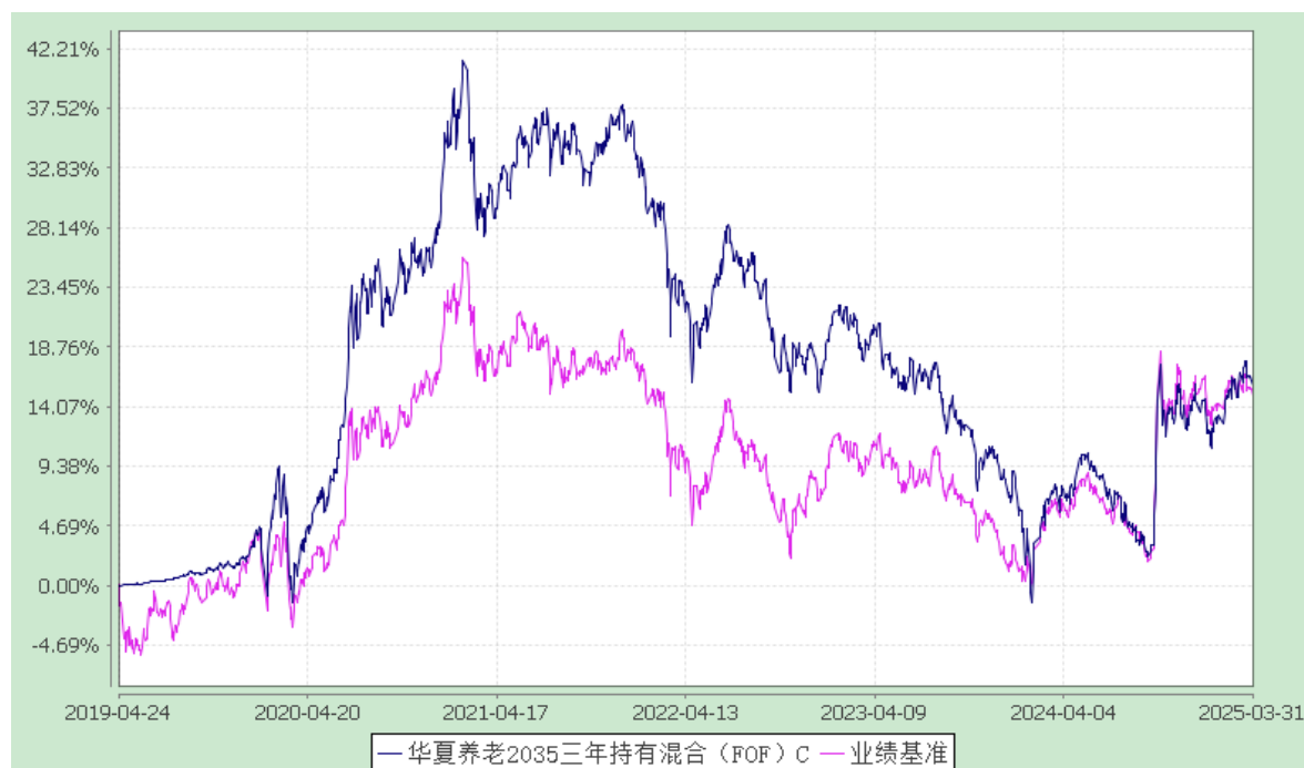
华夏养老 2035 三年持有混合（FOF）Y：