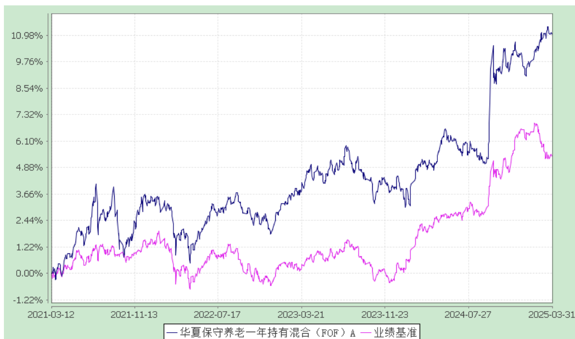
华夏保守养老一年持有混合（FOF）Y：