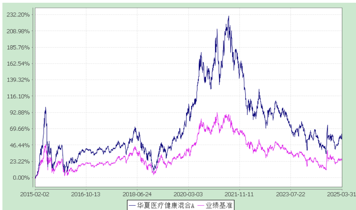
华夏医疗健康混合 C: