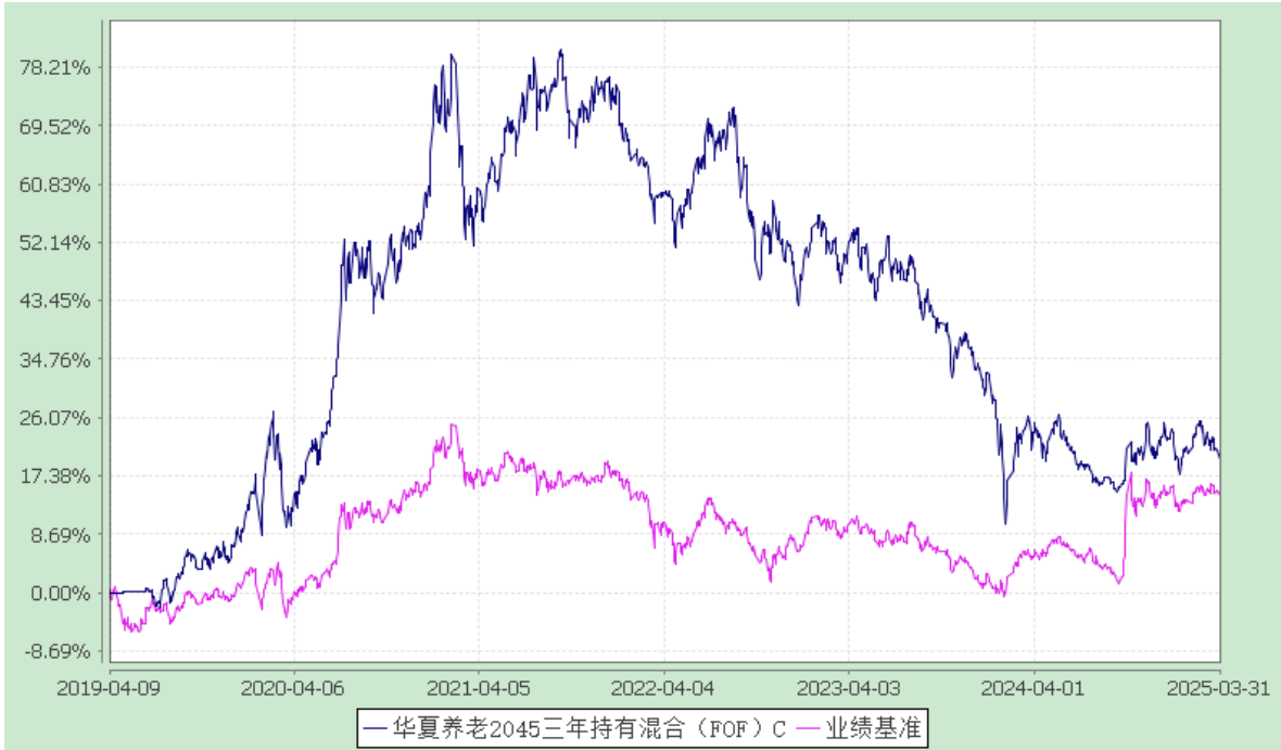
华夏养老 2045 三年持有混合（FOF）Y：