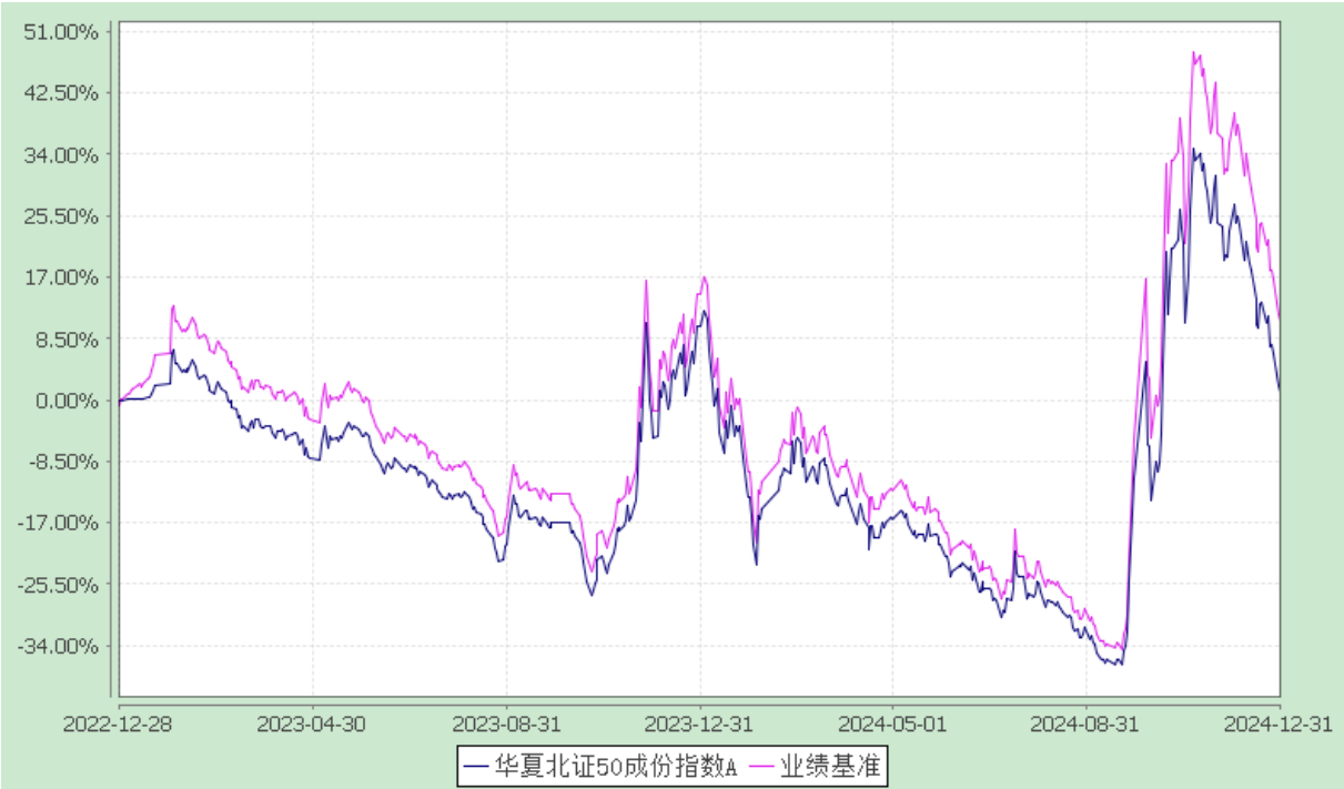
份额累计净值增长率与业绩比较基准收益率历史走势对比图 (2022 年 12 月 28 日至 2024 年 12 月 31 日)

3.2.2 自基金合同生效以来基金份额累计净值增长率变动及其与同期业绩比较基准收益率变动的比较