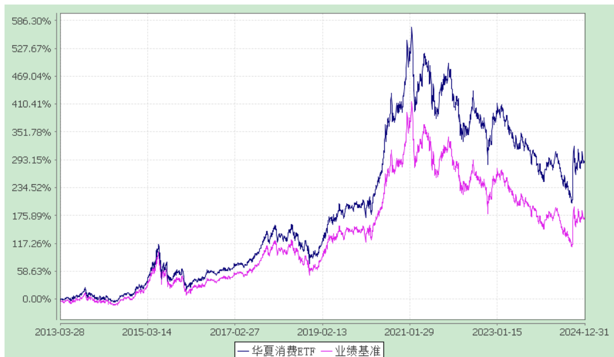
上证主要消费交易型开放式指数发起式证券投资基金 份额累计净值增长率与业绩比较基准收益率历史走势对比图 (2013 年 3 月 28 日至 2024 年 12 月 31 日)