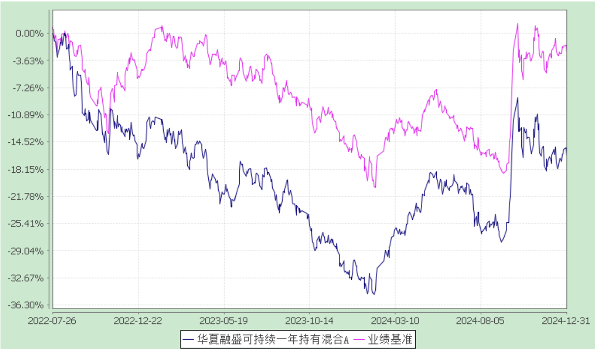
华夏融盛可持续一年持有混合 C