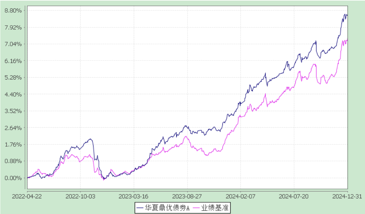
份额累计净值增长率与业绩比较基准收益率历史走势对比图 (2022 年 4 月 22 日至 2024 年 12 月 31 日)