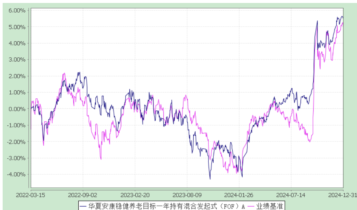
华夏安康稳健养老目标一年持有混合发起式（FOF）Y