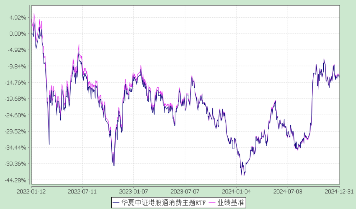
华夏中证港股通消费主题交易型开放式指数证券投资基金