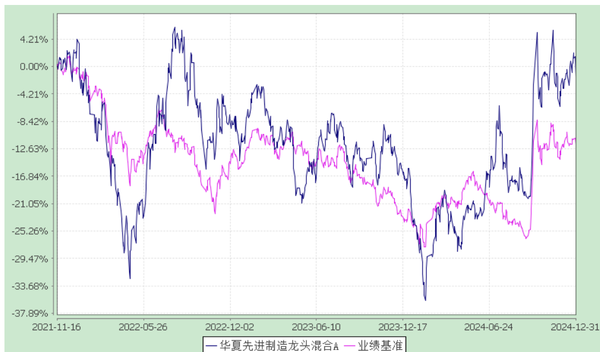
华夏先进制造龙头混合 C