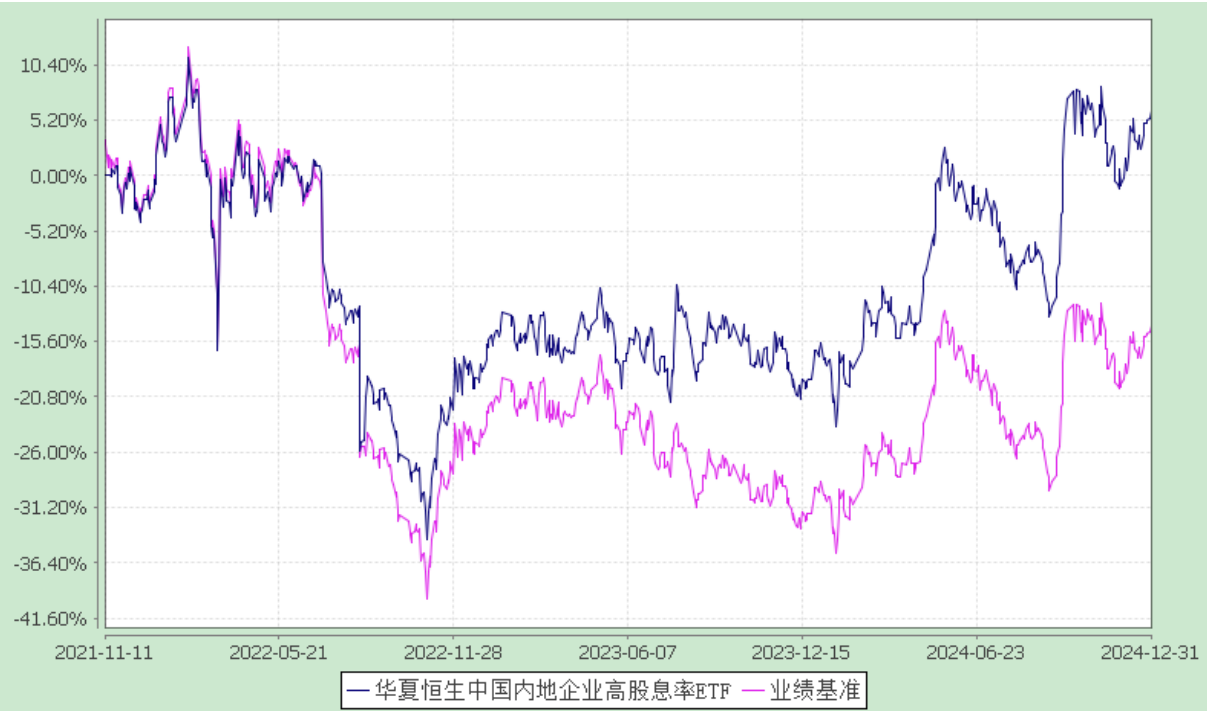
华夏恒生中国内地企业高股息率交易型开放式指数证券投资基金 份额累计净值增长率与业绩比较基准收益率历史走势对比图 (2021 年 11 月 11 日至 2024 年 12 月 31 日)