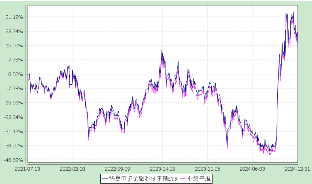
华夏中证金融科技主题交易型开放式指数证券投资基金 自基金合同生效以来基金净值增长率与业绩比较基准收益率的对比图