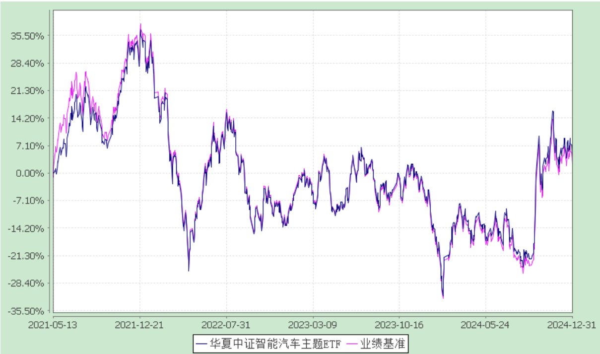
华夏中证智能汽车主题交易型开放式指数证券投资基金 自基金合同生效以来基金净值增长率与业绩比较基准收益率的对比图