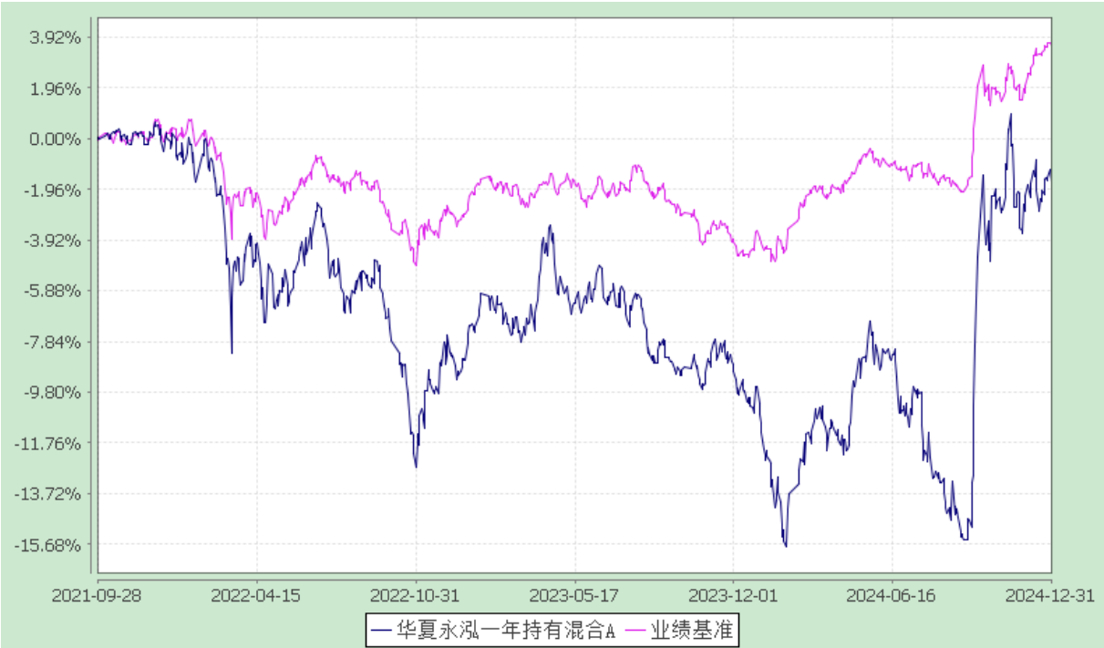
份额累计净值增长率与业绩比较基准收益率历史走势对比图 (2021 年 9 月 28 日至 2024 年 12 月 31 日)