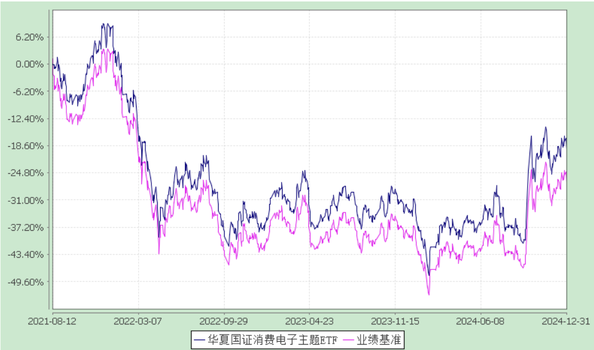
华夏国证消费电子主题交易型开放式指数证券投资基金 自基金合同生效以来基金净值增长率与业绩比较基准收益率的对比图