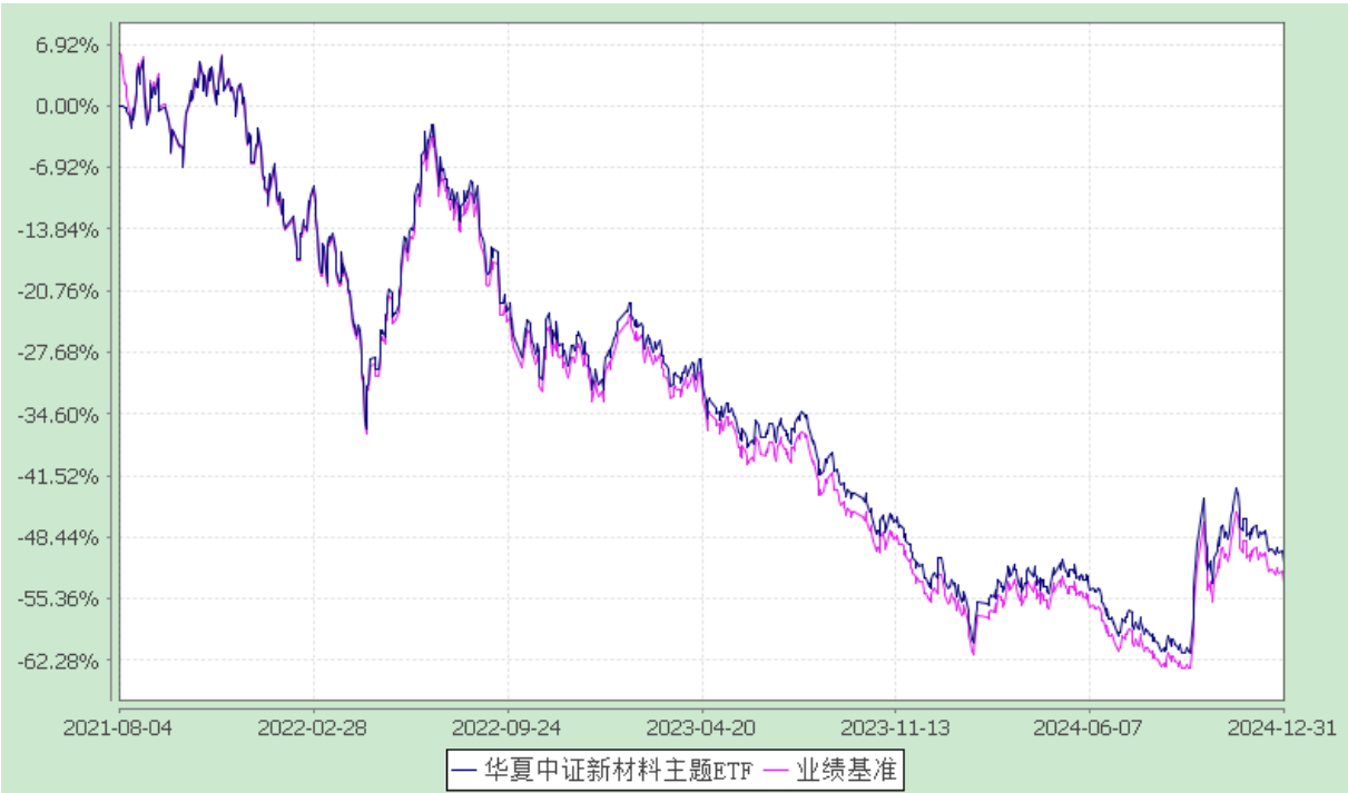
华夏中证新材料主题交易型开放式指数证券投资基金 自基金合同生效以来基金净值增长率与业绩比较基准收益率的对比图