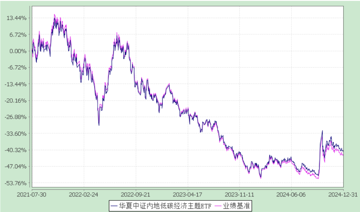
华夏中证内地低碳经济主题交易型开放式指数证券投资基金 自基金合同生效以来基金净值增长率与业绩比较基准收益率的对比图