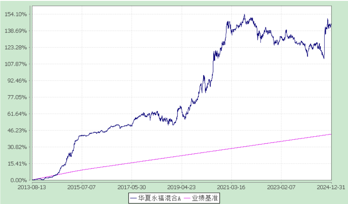
华夏永福混合型证券投资基金 份额累计净值增长率与业绩比较基准收益率历史走势对比图 (2013 年 8 月 13 日至 2024 年 12 月 31 日)

3.2.2 自基金合同生效以来基金份额累计净值增长率变动及其与同期业绩比较基准收益率变动的比较