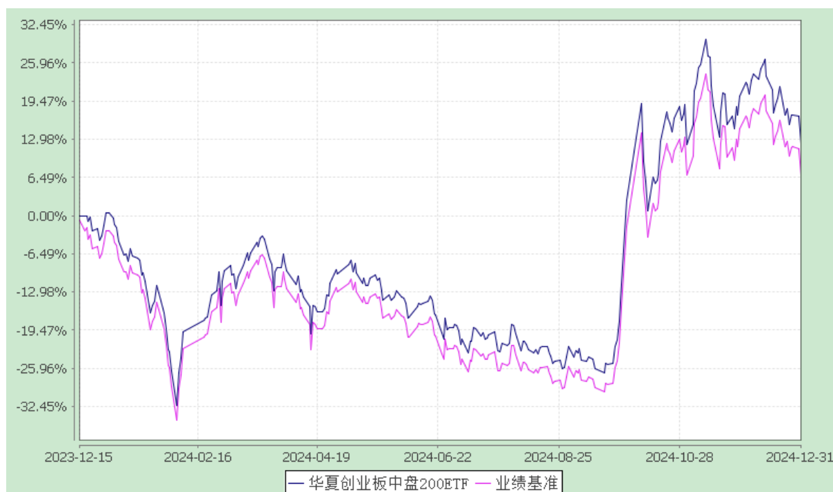
华夏创业板中盘 200 交易型开放式指数证券投资基金 份额累计净值增长率与业绩比较基准收益率历史走势对比图 (2023 年 12 月 15 日至 2024 年 12 月 31 日)

注：根据本基金的基金合同规定，本基金自基金合同生效之日起 6 个月内使基金的投资组合比例符合本基金合同中投资范围、投资限制的有关约定。