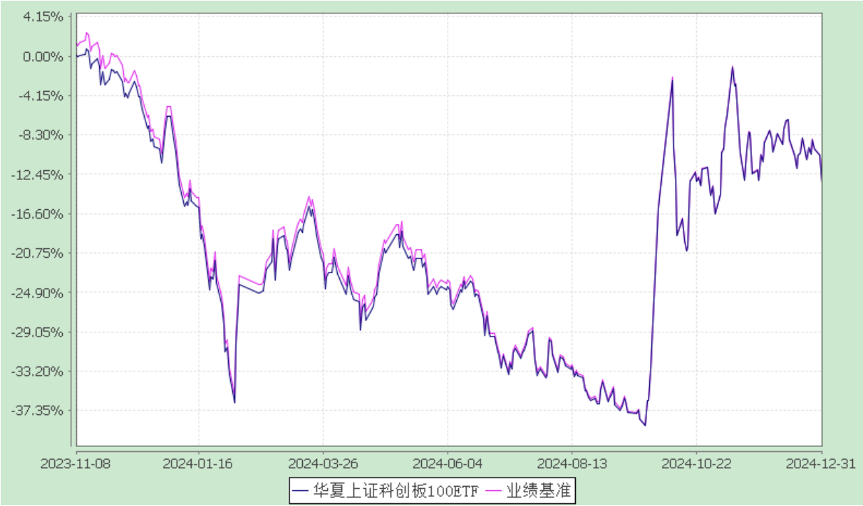
华夏上证科创板 100 交易型开放式指数证券投资基金 份额累计净值增长率与业绩比较基准收益率历史走势对比图 (2023 年 11 月 8 日至 2024 年 12 月 31 日)

注：根据本基金的基金合同规定，本基金自基金合同生效之日起 6 个月内使基金的投资组合比例符合本基金合同中投资范围、投资限制的有关约定。