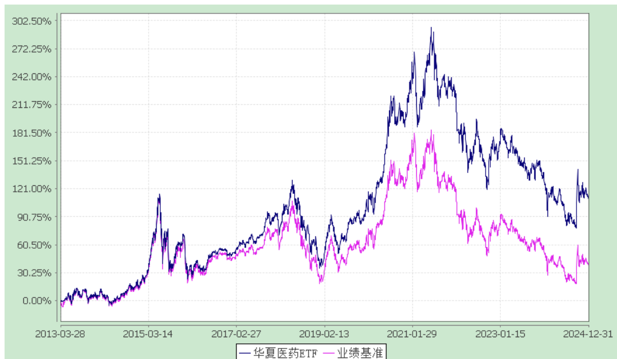
上证医药卫生交易型开放式指数发起式证券投资基金 份额累计净值增长率与业绩比较基准收益率历史走势对比图 (2013 年 3 月 28 日至 2024 年 12 月 31 日)