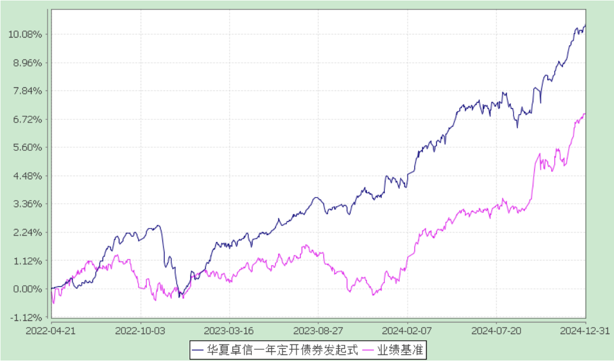
华夏卓信一年定期开放债券型发起式证券投资基金 份额累计净值增长率与业绩比较基准收益率历史走势对比图 (2022 年 4 月 21 日至 2024 年 12 月 31 日)