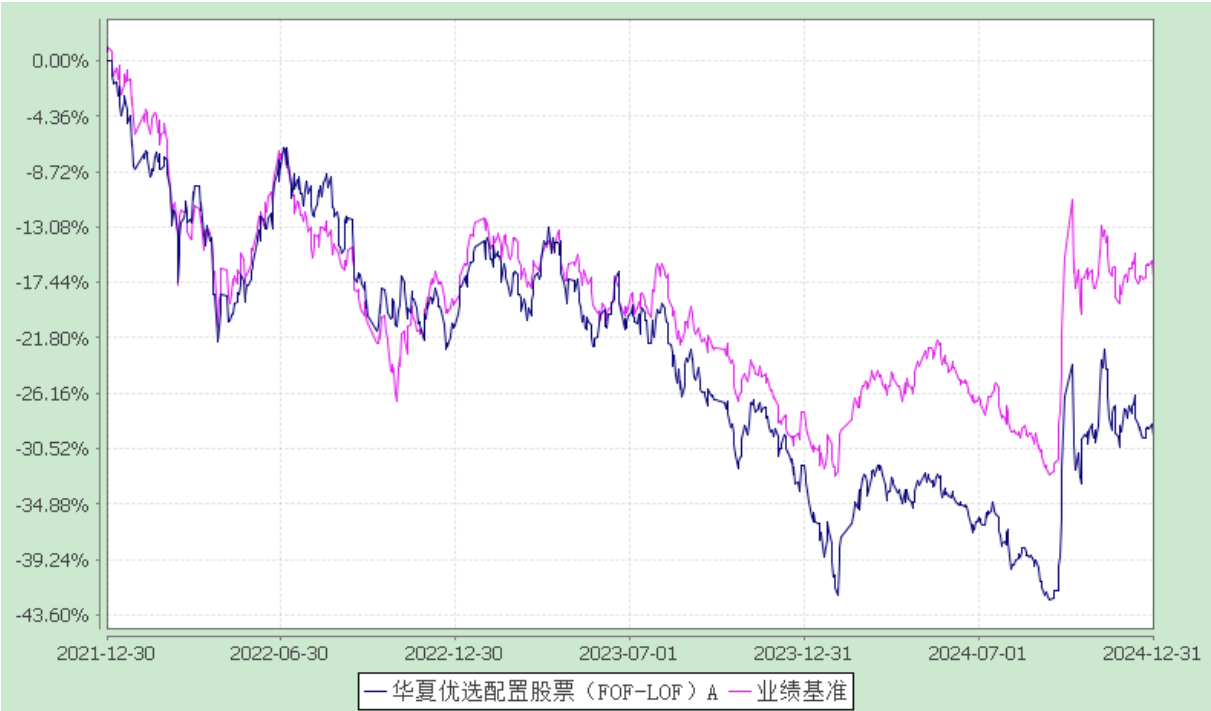
份额累计净值增长率与业绩比较基准收益率历史走势对比图 (2021 年 12 月 30 日至 2024 年 12 月 31 日)

3.2.2 自基金合同生效以来基金份额累计净值增长率变动及其与同期业绩比较基准收益率变动的比较