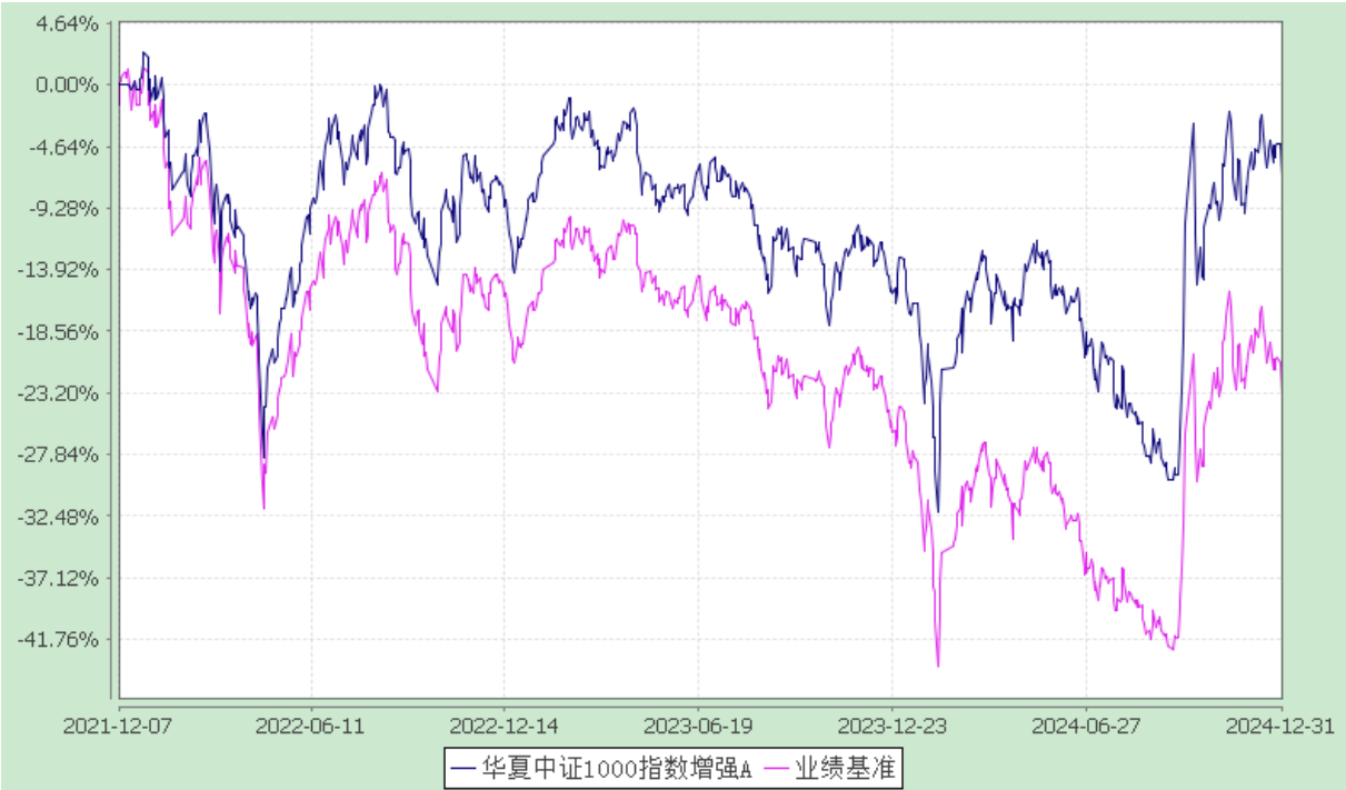
份额累计净值增长率与业绩比较基准收益率历史走势对比图 (2021 年 12 月 7 日至 2024 年 12 月 31 日)

3.2.2 自基金合同生效以来基金份额累计净值增长率变动及其与同期业绩比较基准收益率变动的比较