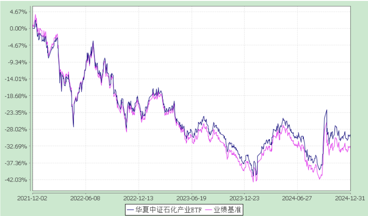
华夏中证石化产业交易型开放式指数证券投资基金 自基金合同生效以来基金净值增长率与业绩比较基准收益率的对比图