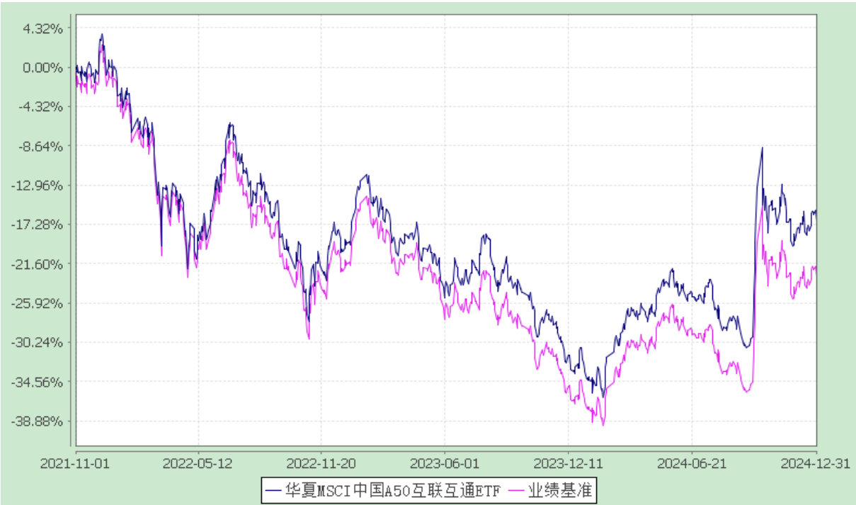
华夏 MSCI 中国 A50 互联互通交易型开放式指数证券投资基金 自基金合同生效以来基金净值增长率与业绩比较基准收益率的对比图