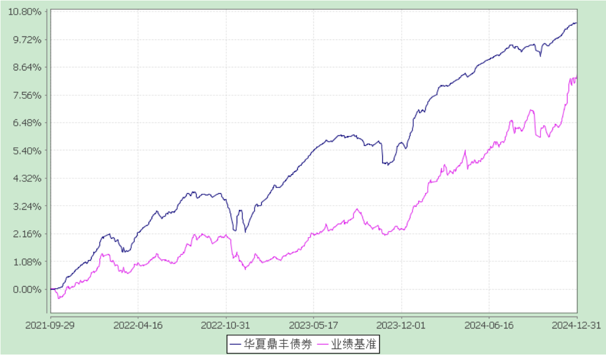
华夏鼎丰债券型证券投资基金 自基金合同生效以来基金净值增长率与业绩比较基准收益率的对比图