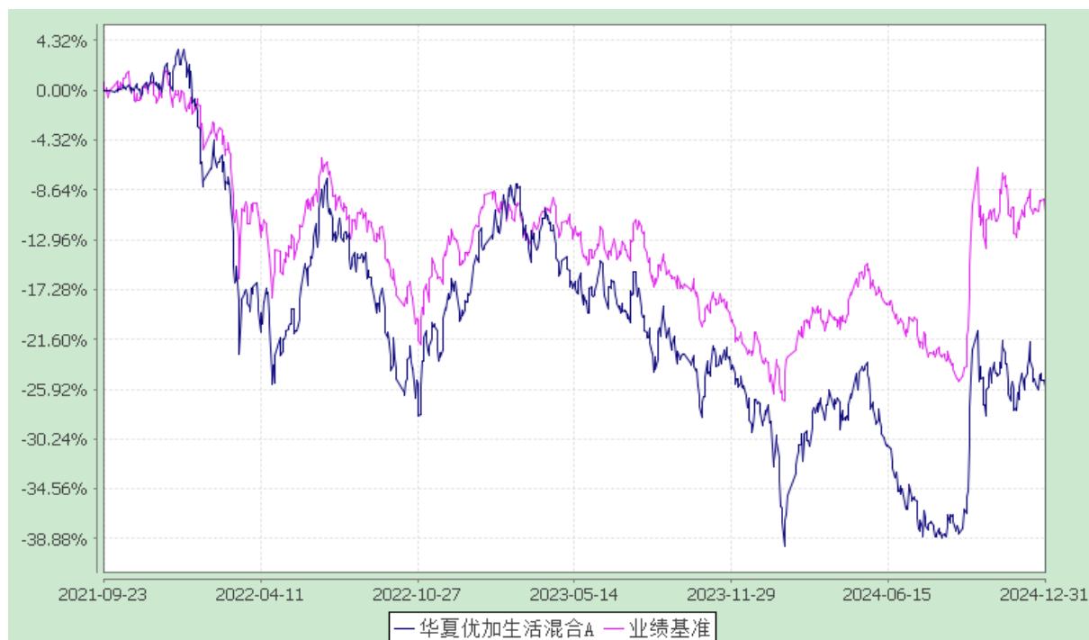
华夏优加生活混合 C