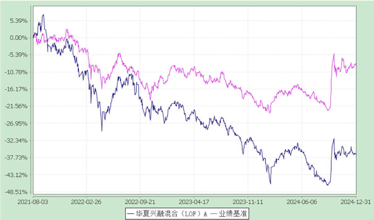
份额累计净值增长率与业绩比较基准收益率历史走势对比图 (2021 年 8 月 3 日至 2024 年 12 月 31 日)

注：本基金自 2021 年 8 月 3 日起由"华夏 3 年封闭运作战略配售灵活配置混合型证券投资基金（LOF）"转型而来。