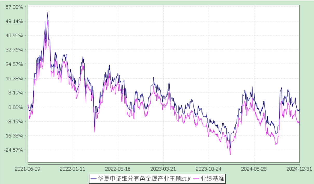
华夏中证细分有色金属产业主题交易型开放式指数证券投资基金 份额累计净值增长率与业绩比较基准收益率历史走势对比图 (2021 年 6 月 9 日至 2024 年 12 月 31 日)