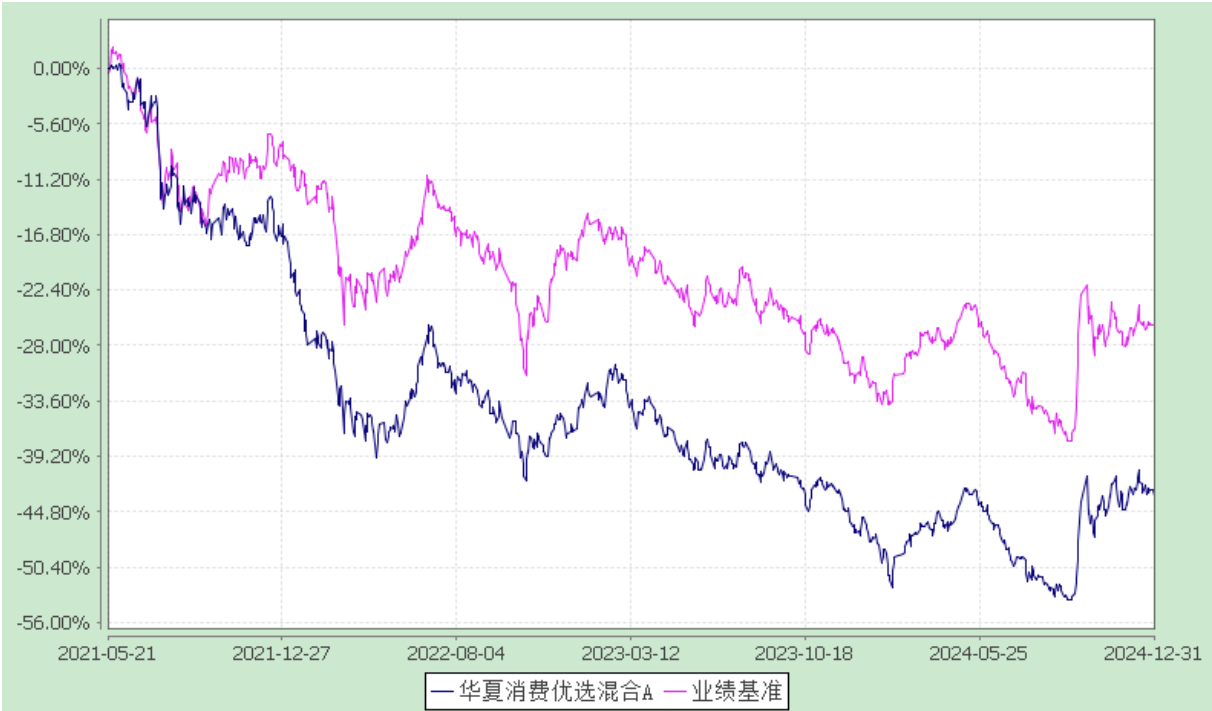
份额累计净值增长率与业绩比较基准收益率历史走势对比图 (2021 年 5 月 21 日至 2024 年 12 月 31 日)

3.2.2 自基金合同生效以来基金份额累计净值增长率变动及其与同期业绩比较基准收益率变动的比较