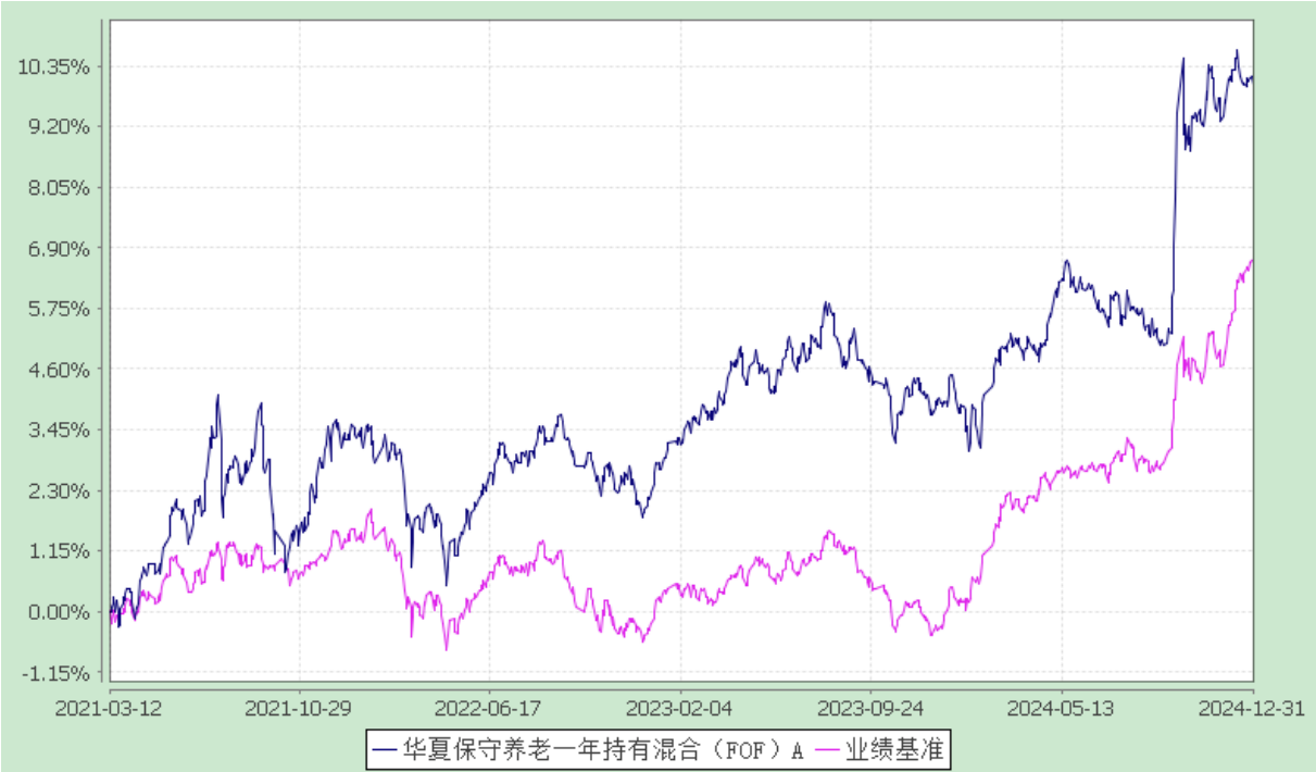
份额累计净值增长率与业绩比较基准收益率历史走势对比图 (2021 年 3 月 12 日至 2024 年 12 月 31 日)

②2022 年 11 月 16 日至 2022 年 11 月 28 日期间，华夏保守养老一年持有混合（FOF）Y 类基金份额为零。