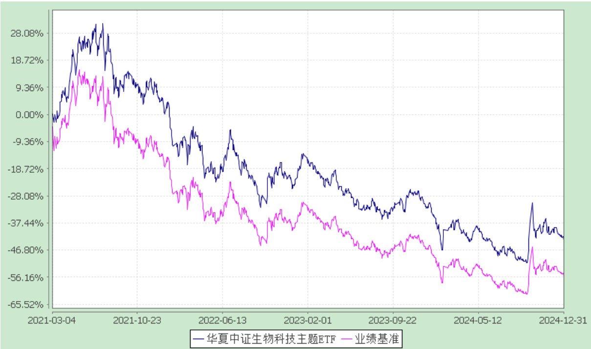
华夏中证生物科技主题交易型开放式指数证券投资基金 自基金合同生效以来基金净值增长率与业绩比较基准收益率的对比图