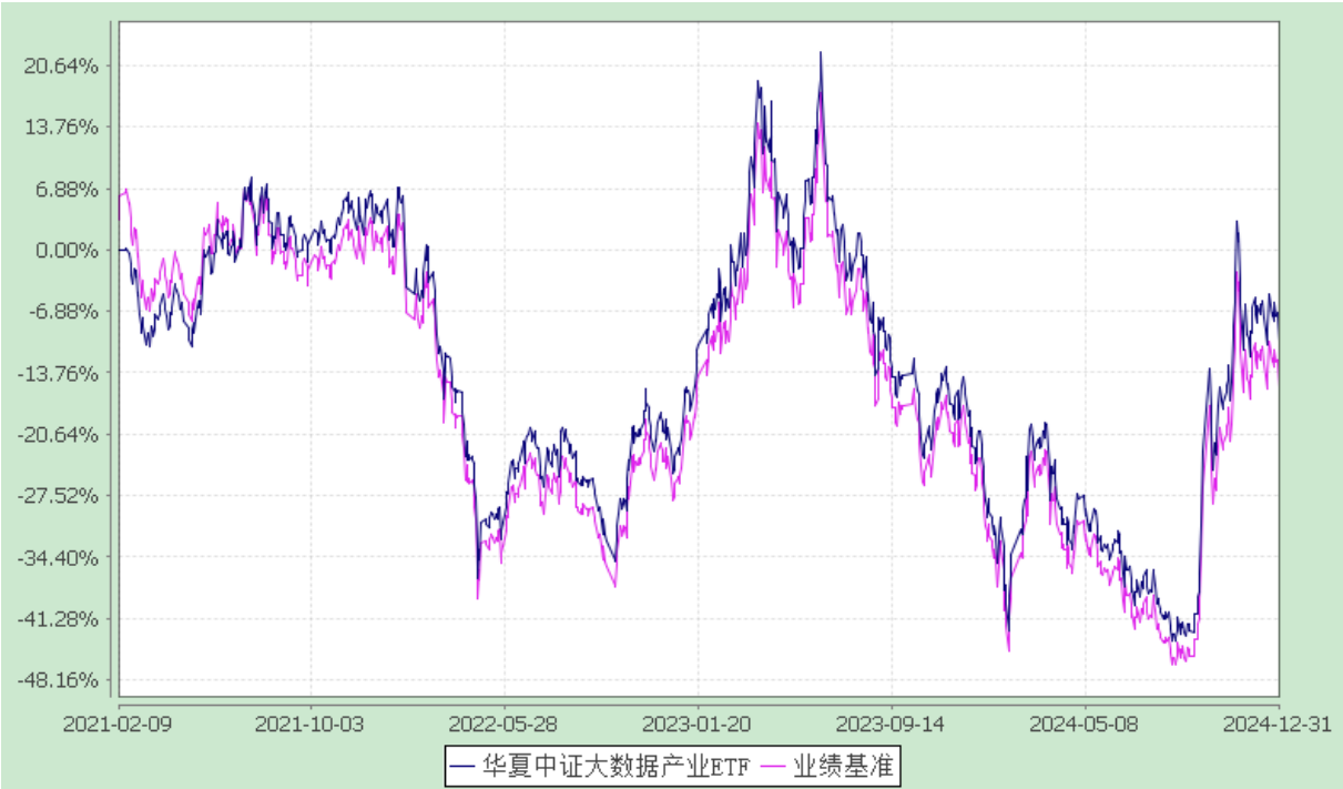
华夏中证大数据产业交易型开放式指数证券投资基金 份额累计净值增长率与业绩比较基准收益率历史走势对比图 (2021 年 2 月 9 日至 2024 年 12 月 31 日)