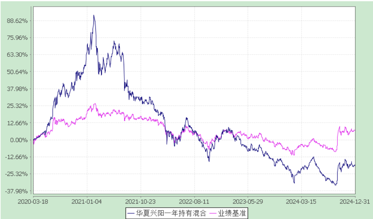
华夏兴阳一年持有期混合型证券投资基金 自基金合同生效以来基金净值增长率与业绩比较基准收益率的对比图