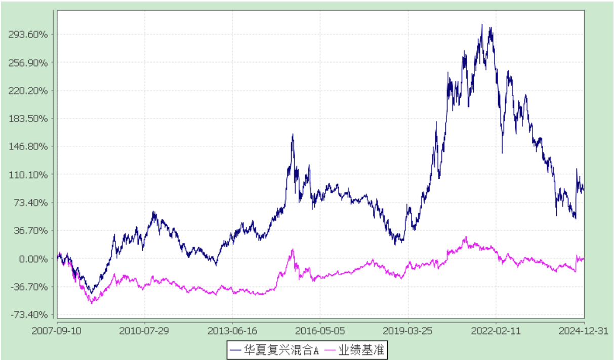
华夏复兴混合型证券投资基金 份额累计净值增长率与业绩比较基准收益率历史走势对比图 (2007 年 9 月 10 日至 2024 年 12 月 31 日)