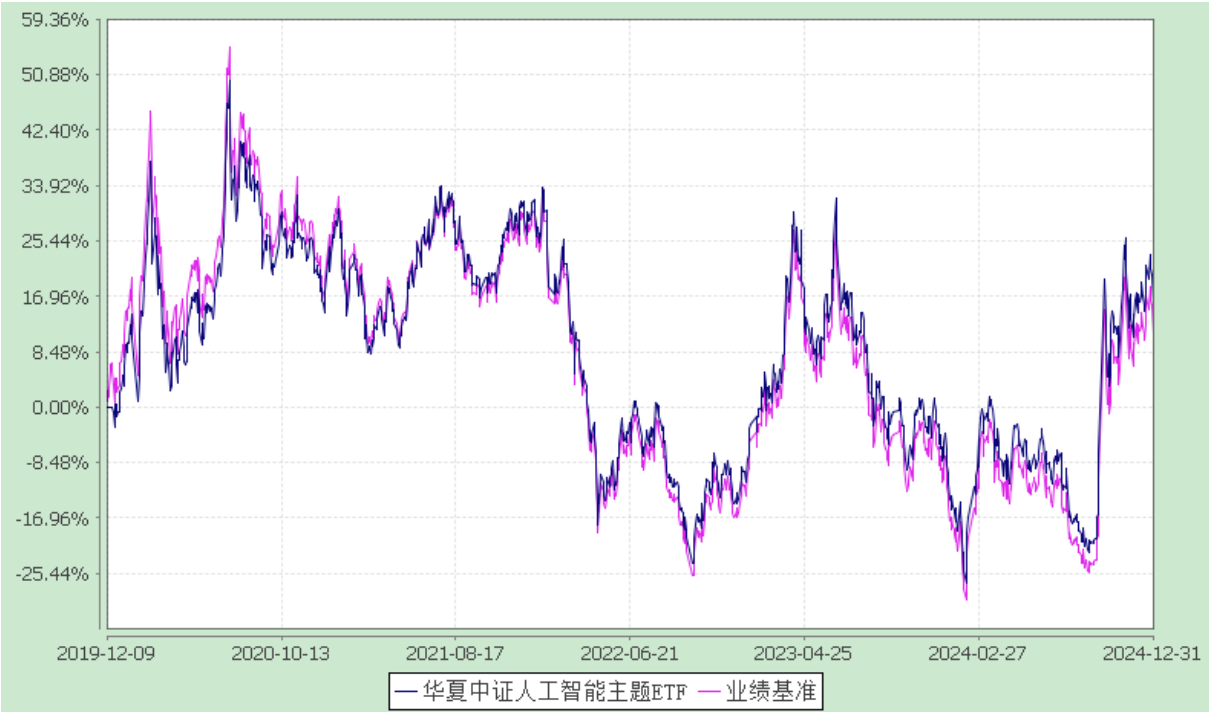
华夏中证人工智能主题交易型开放式指数证券投资基金 过去五年基金净值增长率与业绩比较基准收益率的对比图