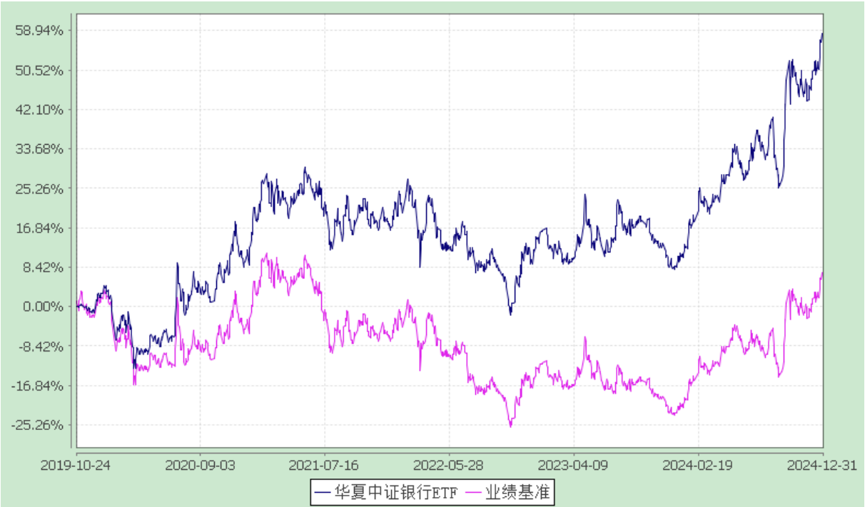
华夏中证银行交易型开放式指数证券投资基金 过去五年基金净值增长率与业绩比较基准收益率的对比图